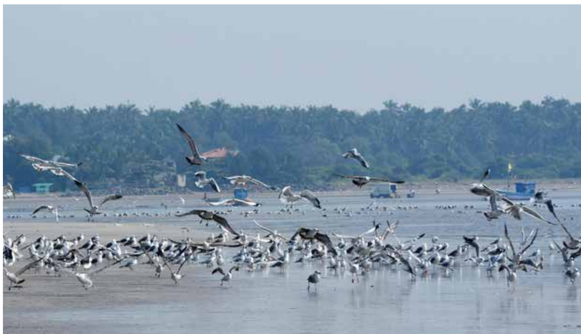
अलिबाग : येथील समुद्रकिनारी थंडीच्या हंगामात परदेशी सी-गल पक्ष्यांची संख्या वाढत चालली आहे. निसर्गाच्या सानिध्यात फिरण्यासाठी आलेले पर्यटक हे पक्षी पाहण्याचा आनंद आवर्जून घेतात.