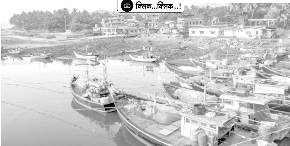
मुठुड : येथे दत्त जयंतीसाठी कोळी बांधव किनारी बोट घेऊन परतले. किनाऱ्यावर सजवलेल्या या बोटी दिसत आहेत.