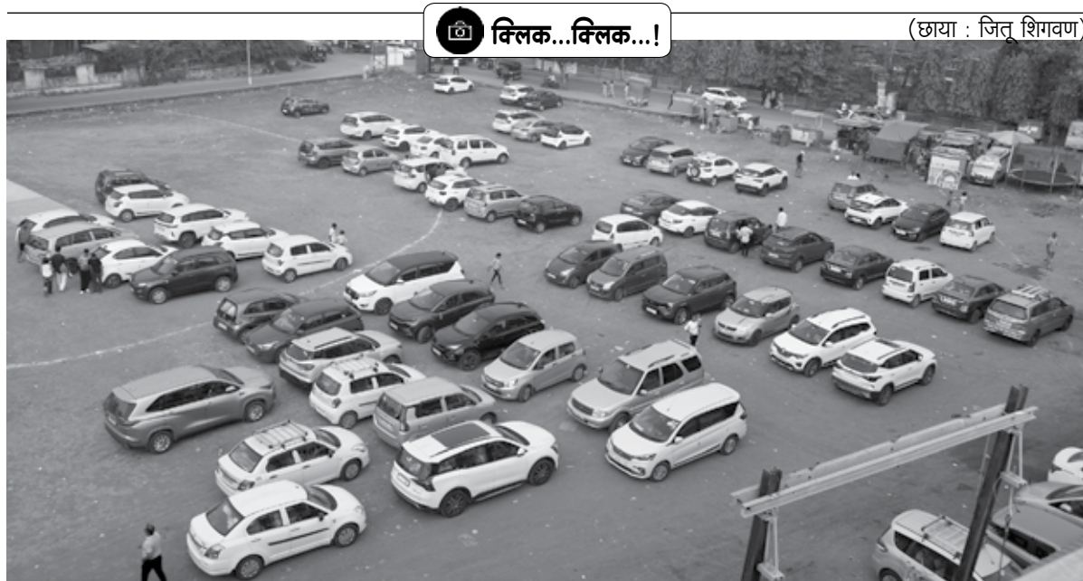
अलिबाग : नाताळच्या सुट्ट्यांमध्ये समुद्र किनारी पर्यटकांची गर्दी झाल्याने खेळाच्या मैदानावर गाड्या पार्क केल्या जातात.

हे फीचर डॉक्युमेंट कसे आणि कुठून क्रॉप करावे यासाठीदेखील सूचना देईल. या व्यतिरिक्त तुम्हाला कॉन्ट्रास्ट आणि ब्राइटनेससुद्धा झेस्ट करण्यात मदत करेल. आयओएस अपडेटचा भाग म्हणून या फीचरची माहिती दिली आहे. स्कॅनरची गुणवत्ता चांगली असेल. तुम्ही स्कॅन करून पाठवलेले डॉक्युमेंट समोरचा स्पष्टपणे वाचूदेखील शकतो. त्यामुळे स्कॅन केलेले डॉक्युमेंट व्यावसायिक (प्रोफेशनल) पद्धतीने सादर केले जाऊ शकतात, याची खात्री देण्यात आली आहे. त्यामुळे व्यवसायसंबंधित असो किंवा वैयक्तिक, दोन्ही गरजांसाठी हे फीचर बेस्ट ठरणार आहे. पावत्यांपासून ते नोव्हेंपर्यंत अनेक गोष्टी तुम्ही स्कॅन करून पाठवू शकणार आहात.