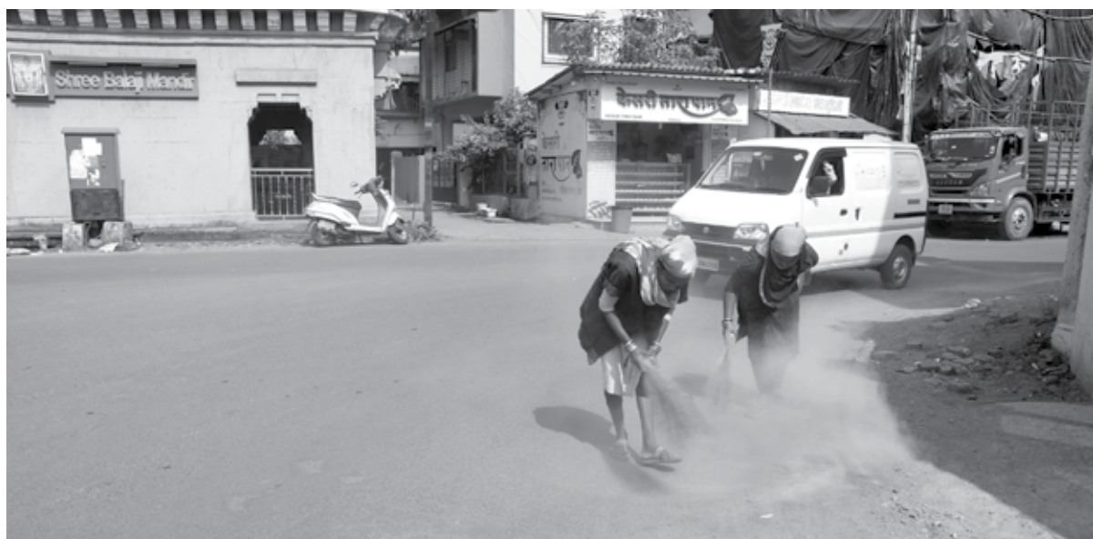
अलिबाग : नवीन वर्षाच्या स्वागतासाठी नमरपालिकेकडून रोषणाईसह रोडची साफसफाई करण्यात आली आहे.