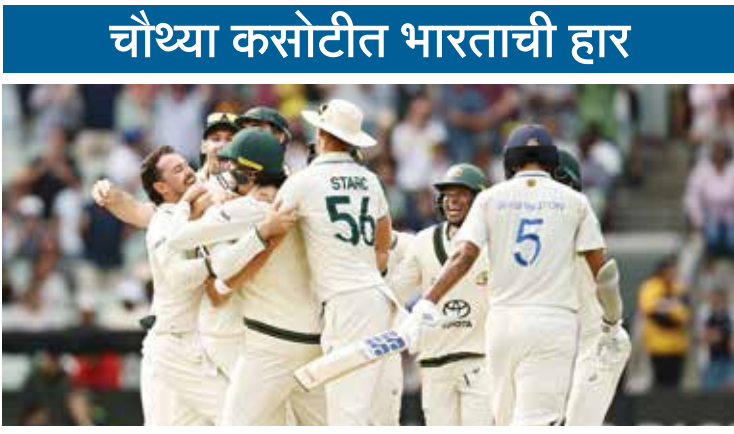
चौथ्या कसोटीत भारताची हार

मेलबर्न : वृत्तसंस्था भारताला नमवत अखेरीस ऑस्ट्रेलियाने मेलबर्न क्रिकेट ग्राऊंडवर विजय नोंदवला आहे. ऑस्ट्रेलियाने मेलबर्न कसोटीत भारताचा १८४ धावांनी पराभव करत मोठा विजय नोंदवला आहे. या विजयासह ऑस्ट्रेलियाने बॉर्डर गावस्कर ट्रॉफीमध्ये २-१ने आघाडी मिळवली आहे. एका क्षणाला भारतीय संघ हा कसोटी सामनाही झेवळ करेल अशी आशा होती, पण यशस्वी जैस्वाल वगळता भारताच्या अन्य फलंदाजांनी नांगी टाकली. मेलबर्न कसोटीत ऑस्ट्रेलियाने भारतासमोर विजयासाठी ३४० धावांचे लक्ष्य ठेवले होते, ज्याचा पाठलाग करताना टीम इंडियाचा दुसरा डाव केवळ १५५ धावांवरच आटोपला. भारताच्या सात फलंदाजांनी तासाभरात एकापाठोपाठ आपल्या विकेट्स गमावल्या. चौथ्या दिवशी ९ गडी गमावून ३३३ धावांची आघाडी घेणाऱ्या