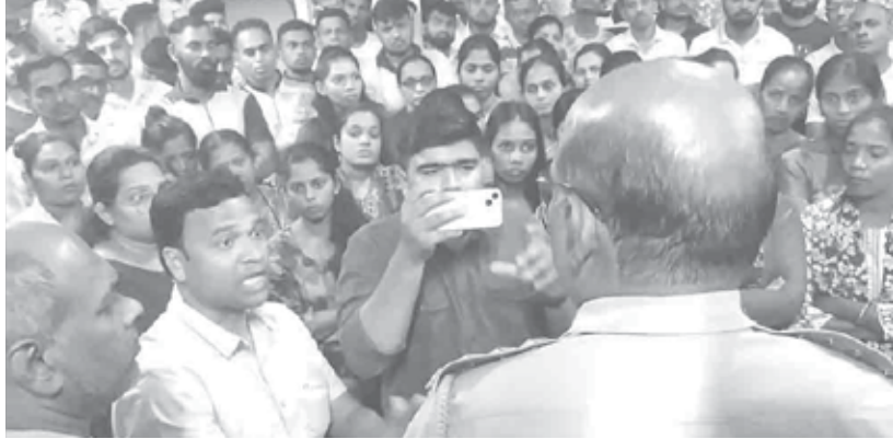
रोहा : वरसे गावातील एका अल्पवयीन मुलीसोबत गैरप्रकार घडल्यानंतर संतप्त ग्रामस्थांनी पोलीस ठाण्यात जाऊन आरोपीला कठोर शिक्षा व्हावी, अशी मागणी पोलीस अधिकाऱ्यांकडे केली.