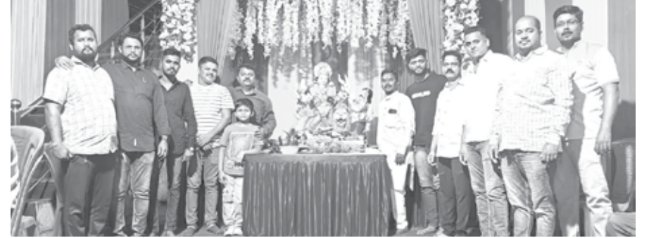
खालापूर : शिवतेज मित्र मंडळाच्या नवरात्रोत्सवातील देवीचे अनेकांनी दर्शन घेतले.

सदर अभियानातील नाविन्यपूर्ण उपक्रमांतर्गत आजी-माजी सैनिकांना मालमत्ता करातून सूट देण्याबाबत सूचना दिल्या. खोपोली नगरपालिका हद्दीतील एकूण ४३ आजी-माजी सैनिकांना मालमत्ता करातून सूट देण्यात आल्याचा कार्यक्रम तहसीलदार व खोपोली नगर परिषद यांच्या संयुक्त विद्यमाने आयोजित केला होता.