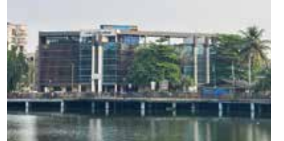
पनवेल महापालिकेच्या महापौर आणि उपमहापौरपद निवडीचा अधिकृत कार्यक्रम प्रशासनाकडून जाहीर करण्यात आला आहे.

महापौर, उपमहापौरपदासाठी ६ फेब्रुवारी रोजी नामनिर्देशनपत्र सादर करावे लागेल. सकाळी ११ ते दुपारी ३ या वेळेत महापालिका सचिवांच्या दालनात स्वतः उपस्थित राहून विहित नमुन्यातील अर्ज सादर करणे बंधनकारक आहे. त्यानंतर १० फेब्रुवारी रोजी सकाळी ११ वाजता निवडीसाठी विशेष सभा सुरू होईल. सभेच्या सुरुवातीला अर्जाची मुदत संपल्यावर प्रत्यक्ष निवडणूक प्रक्रिया सुरू होईल. पीठासीन अधिकारी उमेदवारांची नावे वर्णानुक्रमाने पुकारतील. या वेळी प्रत्येक उमेदवारासाठी हात उंचावून मतांची नोंद घेतली जाईल. त्यानंतर पीठासीन अधिकारी तत्काळ निकाल घोषित करतील. महापौरपदाची निवड प्रक्रिया पूर्ण झाल्यानंतर त्याचपद्धतीने उपमहापौरपदाची निवडणूक होणार आहे.