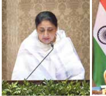
सुनेत्रा पवार यांनी उपमुख्यमंत्रिपदाची शपथ घेतली.

यानंतर राष्ट्रवादीचे कार्यध्यक्ष प्रफुल्ल पटेल, प्रदेशाध्यक्ष सुनील तटकरे, छगन भुजबळ, धनंजय मुंडे, संजय बनसोडे