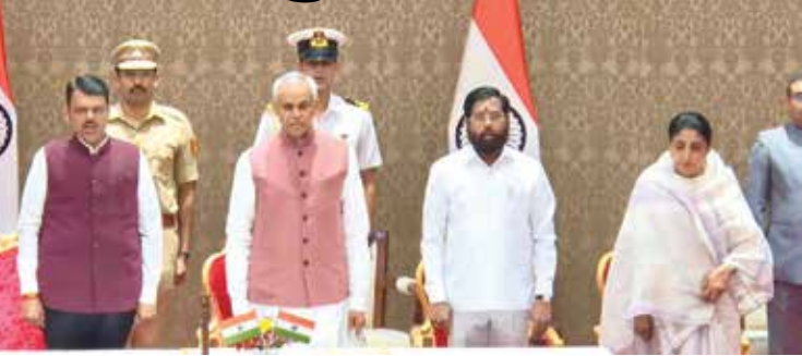
सुनेत्रा पवार यांच्यासोबत असलेले अधिकारी.

महाराष्ट्र राज्याच्या उपमुख्यमंत्रिपदाची धुरा सांभाळणाऱ्या सुनेत्रा पवार यांना त्यांच्या नवीन कार्यकाळासाठी हार्दिक शुभेच्छा! हे जबाबदारीचे पद भूषवणाऱ्या त्या राज्यातील पहिल्या महिला आहेत. त्या राज्याच्या जनतेच्या कल्याणासाठी अथक परिश्रम घेतील आणि दिवंगत अजितदादा पवार यांचे स्वप्न पूर्ण करतील, असा मला ठाम विश्वास आहे.