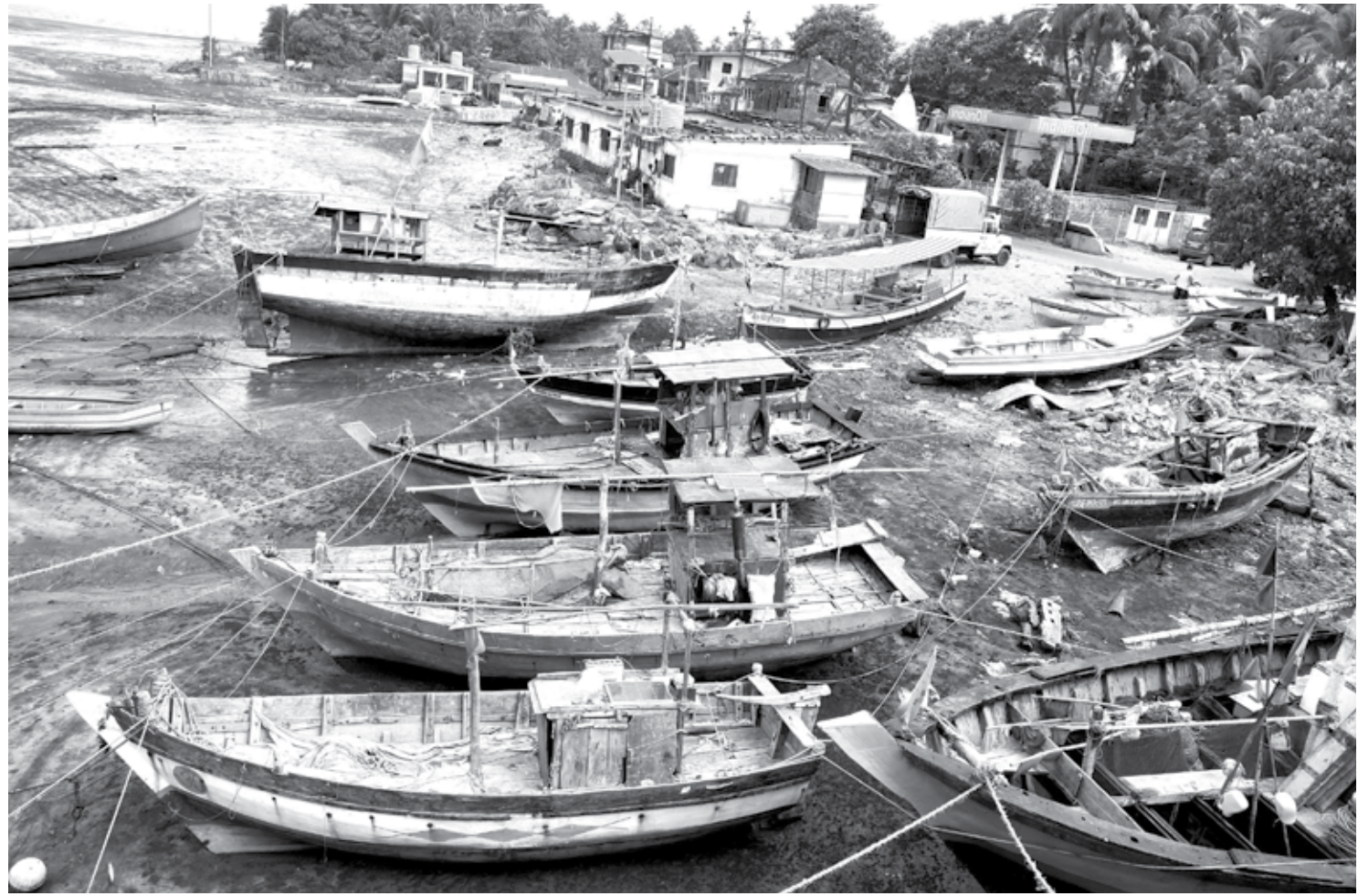
मुळुड : कोळीवाड्यात कोळी बांधव आपल्या बोटी किनारी आणून शाकारण्याच्या तयारीत आहेत. खराब हवामानामुळे मासे मिळत नसल्याने लवकरच मासेमारी बंद होणार आहे . ही पाऊस लवकर असल्याने ती तयारी सुरु झाली आहे.

सभागृहात आयोजित केला आहे. लोकशाही दिनाकरिता नागरिकांनी प्रथम तालुका लोकशाही दिनात अर्ज सादर करणे बंधनकारक आहे. उत्तराने समाधान न झाल्यास जिल्हास्तरीय लोकशाही दिनात अर्ज करू शकतात,