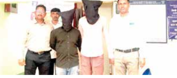
टनटन आणि एकलहरी बाबाला अटक

यातील पीडित महिलेला काही वारंवार संकटे येत होती. त्या नैराश्यातून नेमकी ती एकलहरी बाबा आणि त्यांचा गुरू टनटन बाबा यांच्या संपर्कात