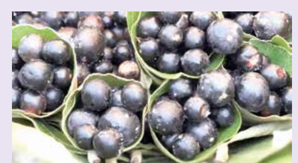
चवीसोबतच औषधी गुणधर्मांमुळे करवंदांना मागणी

पनवेल : रामप्रहार वृत्त उन्हाळ्याच्या सुट्ट्या आणि डाॅंगरगांमध्ये मिळणाऱ्या रानमेव्याचा अनोखा संगम सध्या पनवेलच्या भाजी मार्केटमध्ये पाहायला मिळत आहे. डाॅंगराची काळी मैना म्हणून ओळखली जाणारी काळी करवंद सध्या बाजारात दाखल झाली असून कडक्याच्या उन्हातही ही खरेदी करण्यासाठी ग्राहकांची मोठी उत्सुकता आणि गर्दी दिसून येत आहे. काळी पिकलेली करवंद पाहताच अनेक ग्राहकांच्या बालपणीच्या आठवणी ताज्या होत आहेत. लहानपणी करवंद हातात धरून "कोंबडा की