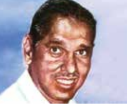
नोड सेक्टर १२मधील रामशेट ठाकूर मैदान येथे माजी खासदार