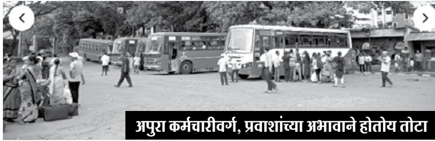
अपुरा कर्मचारीवर्ग, प्रवाशांच्या अभावाने होतोय तोटा

या संदर्भात प्राप्त झालेल्या माहितीनुसार महाड एसटी आगारात मागील वर्षी चालक वाहकांच्या संख्येत भरती करण्यात आली असली तरीही कार्यशाळा व लिपिक पदांच्या सुमारे ६० पेक्षा जागा रिक्त