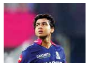
माजी कर्णधार सौरव गांगुली यांचे मत

'वंडर बॉय' म्हणून ओळखला जाणारा १५ वर्षीय वैभव सूर्यवंशी स्फोटक फलंदाजीने सर्वांचे लक्ष वेधून घेत आहे. २०२६ आयपीएलमध्ये राजस्थान रॉयल्सकडून खेळताना त्याने लीग टप्प्यात ५०० हून अधिक धावा केल्या. आयपीएलमधील वैभवची स्फोटक फलंदाजी पाहून क्रिकेट तज्ज्ञ त्याला भारतीय संघात स्थान देण्याची शिफारस करीत आहेत. त्यांच्या मते वैभवला लवकरच टी-२० संघात समाविष्ट केले पाहिजे. यासंदर्भात माजी कर्णधार सौरव