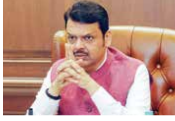
कालांतराने तो न्यायालयाने रद्दबातल ठरवला. आता पुन्हा प्रभावी कायदा तयार करा, जेणेकरून नराधमांना कायद्याची कोणतीही पळवाट मिळणार नाही.

मुख्यमंत्री फडणवीस म्हणाले की, लैंगिक अत्याचाराच्या प्रकरणांतील ८० ते ९० टक्के आरोपी हे आधी त्याच गुन्हाखाली जेलमध्ये असतात आणि पॅरोलवर बाहेर आल्यावर ते पुन्हा तशाच प्रकारचे कृत्य करतात. या गुन्हेगारांची ही साखळी तोडण्यासाठी २०१४ ते २०१९ या काळात राज्य सरकारने लैंगिक अत्याचारातील गुन्हातील आरोपींना पॅरोल मिळू नये असा कायदा केला होता. हा कायदा दोन ते तीन वर्षे अस्तित्वात होता, पण