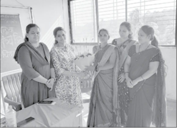
समिती निवडून गावातील कोणत्या विकास कामाला प्राधान्य द्यायचे

याबाबत नुकतीच गावात मिटींग झाली याच्यामध्ये २६ ग्रामस्थांना निवडले असून प्रत्येक आळीमधून आता एक एक