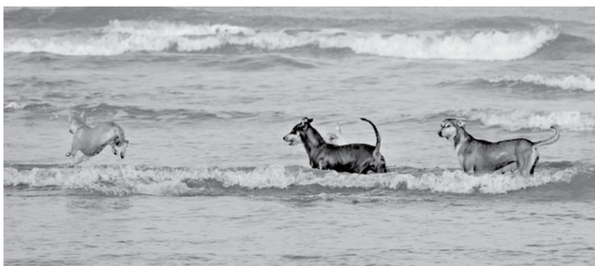
मुरुड : तापमानात वाढ झाली असून उकाड्यापासून बचावासाठी मुक्या प्राण्यांनीही आपला मोर्चा समुद्राकडे वळवला.