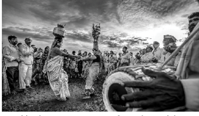
एकात्मतेचे प्रतीक बनला.