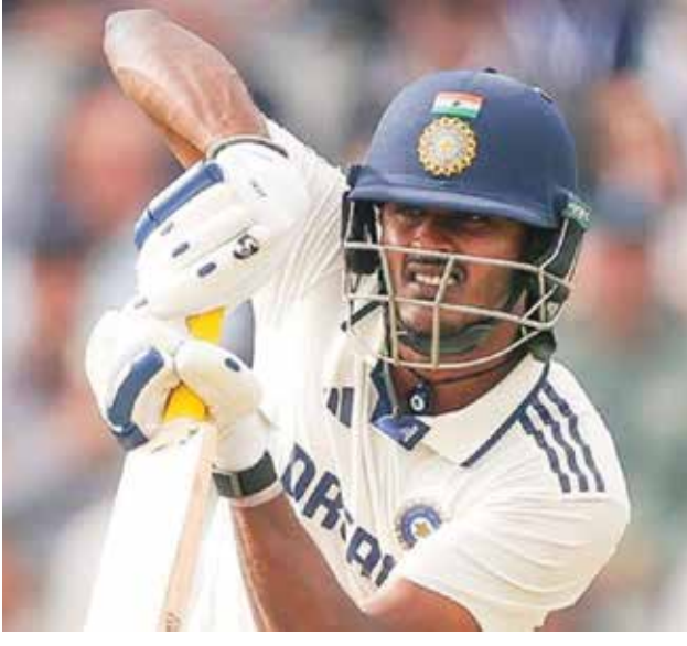
करणे हे खेळाडूंसमोर आव्हान आहे. याबाबत गौतम गंभीरने स्पष्ट केले की कसोटी सामने कणखर मानसिकतेची परीक्षा असतात. त्यामुळे कोणतीही सबब चालणार नाही. गेल्या काही वर्षांपासून

मुल्लनपूर : वृत्तसंस्था भारत आणि अफगाणिस्तान यांच्यात शनिवार (दि. ६) पासून मुल्लनपूर येथे होणाऱ्या एकमेव कसोटी सामन्यासाठी तिसऱ्या क्रमांकावर कोण खेळणार याबाबत मुख्य प्रशिक्षक गौतम गंभीरने महत्त्वाचे संकेत दिले आहेत. साई सुदर्शनला पुरेशा संधी मिळणे गरजेचे असून त्याच्यावरच विश्वास दाखवणार असल्याचे गंभीरने स्पष्ट केले आहे. भारतीय संघ शनिवारपासून अफगाणिस्तानविरुद्ध एकमेव कसोटी सामना खेळणार आहे. आयपीएल २०२६ संपल्यानंतर अवघ्या सहा दिवसांतच कसोटी सामन्यासाठी संघ सज्ज झाला आहे. टी-२०मधून थेट कसोटीची मानसिकता तयार