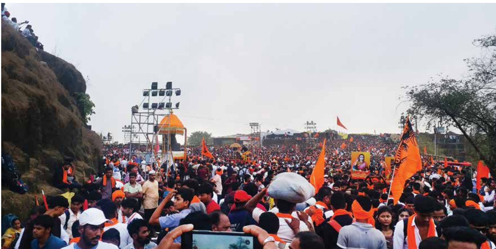
महाड : छत्रपती शिवाजी महाराजांच्या ३५२व्या शिवराज्याभिषेक दिनानिमित्त दुर्गराज रायगडावर इतिहास, परंपरा आणि शिवभक्तीचा अनोखा संगम अनुभवायला मिळाला. या सोहळ्यासाठी राज्याच्या कानाकोपऱ्यातून तसेच देशभरातून हजारो शिवप्रेमींनी उपस्थिती दर्शवली होती. यावेळी शिवभक्तांकडून छत्रपती शिवाजी महाराजांच्या जयघोषाने संपूर्ण रायगड परिसर उमडुन गेला होता.

नोंदणीसाठी संपर्क इच्छुक प्रकल्पग्रस्तांनी प्रशिक्षणासाठी नोंदणी करून अधिक माहितीसाठी मेसर्स विप्रा स्किल इंडिया प्रायव्हेट लिमिटेड, प्लॉट क्र. १२, रोड क्र. २, सेक्टर-१, न्यूपनवेल पूर्व, पनवेल, नवी मुंबई ४१०२०६ येथे संपर्क साधावा. तसेच ७०२१७५२३२४ या मोबाइल क्रमांकावर किंवा mssdsidco@gmail.com या ई-मेलवर संपर्क साधता येईल.