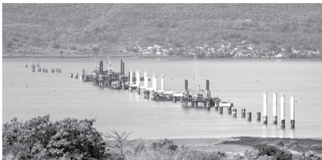
मुरुड : सागरी महामार्गातील मुरुड आणि म्हसळा तालुक्यांना जोडणाऱ्या टोकेखार ते तुरुंबाडी पुलाचे काम गतीने सुरु आहे. यासाठी आगरदांडा खाडीत पिलर उभारले जात आहेत.

पार्सल व्हॅन्सच्या भाडेत्त्वावरील (लीजिंग) सेवेमध्येही सकारात्मक कल दिसून आला.सध्या २२६ एसएलआर भाडेत्त्वावर आहेत. (मागील वर्षी १६३ होत्या) ज्यामुळे २०२६-२७मध्ये १७.२२ कोटी रुपयांचे उत्पन्न मिळाले आहे. तर २०२५-२६च्या कालावधीत हे उत्पन्न १२.३५ कोटी रुपये होते. त्याचप्रमाणे सध्या २४ व्हीपी भाडेत्त्वावर आहेत. (मागील वर्षी २३ होत्या) ज्यातून २०२६-२७मध्ये ९.८२ कोटी रुपयांचे उत्पन्न मिळाले आहे, तर मागील वर्षी हे उत्पन्न ९.७६