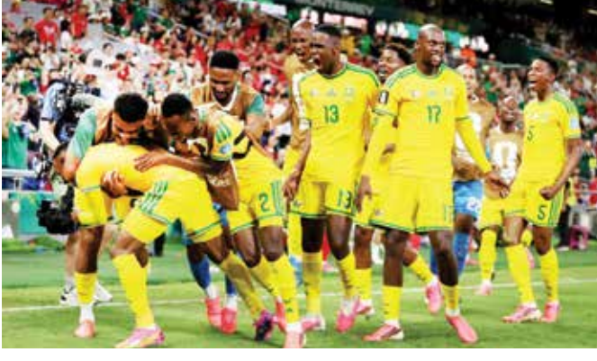
खेळाडू बनवले आहे.

म्हणजे : वृत्तसंस्था दक्षिण आफ्रिकेने रोमांचक सामन्यात दक्षिण कोरियाचा १-०ने पराभव करत विश्वचषकाच्या बाद फेरीत प्रथमच प्रवेश केला. या विजयामुळे दक्षिण आफ्रिकेच्या फुटबॉल इतिहासात एक नवीन अध्याय लिहिला गेला आहे.