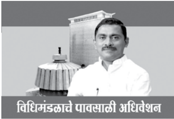
विधिमंडळाचे पावसाळी अधिवेशन