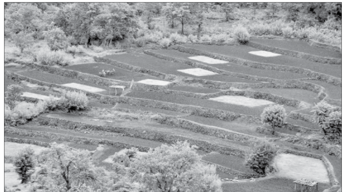
मुरुड : पाऊस पडल्याने शिवारांचे रूप आता पालटू लागले आहे.