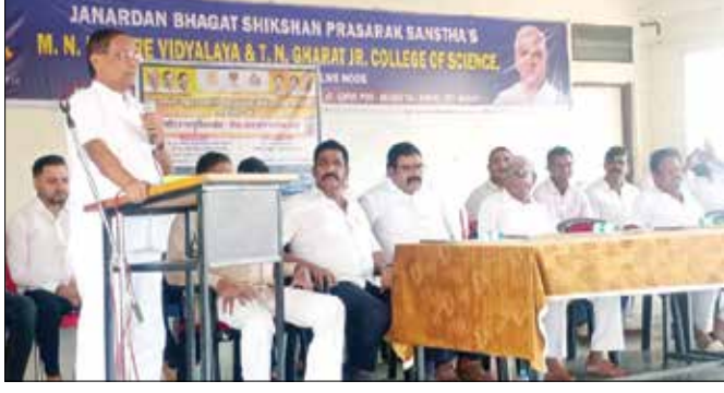
गव्हाण : रामप्रहार वृत्त

गव्हाण विद्यालयात मोफत वह्यावाटप कार्यक्रम उत्साहात