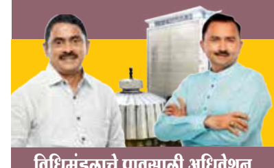
विधिमंडळाचे पावसाळी अधिवेशन