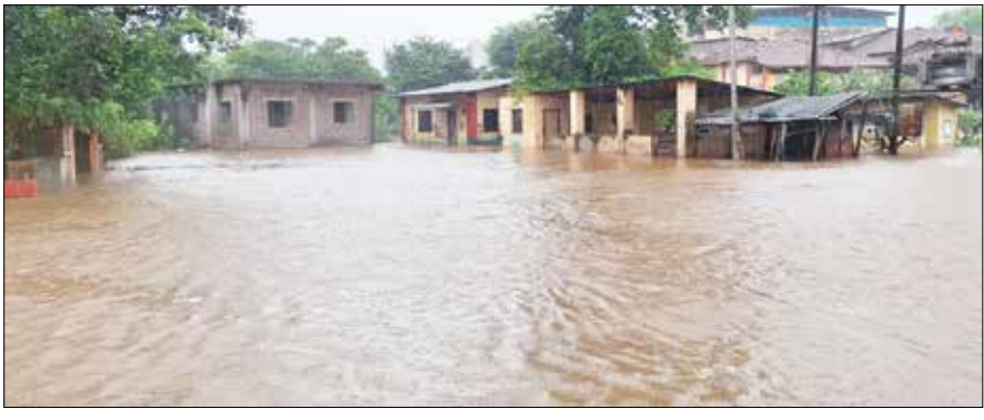
पनवेल : मुसळधार पावसामुळे आपटा गावात पुराचे पाणी शिरले.

अंतरंग मुसळधार पावसाचे नागोठणे जलमय/२ कर्जतमध्ये साकव, पुलांसह घरांमध्ये शिरले पाणी/५ मुरुडमध्ये तुफान पाऊस; भातशीतीही पाण्याखाली/७