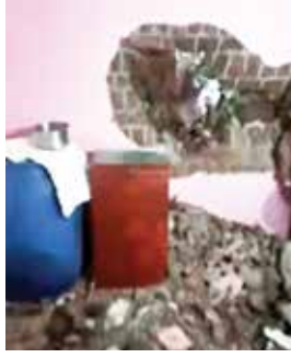
संपर्क तुटला आहे. (सविस्तर पान ५ वर..)

जोरदार पावसामुळे पेण तालुक्यातील खरोशी येथील एका घराच्या मागे दरड कोसळून, तर डोलवी येथील एका घरात पाणी शिरून नुकसान झाले आहे. याशिवाय वळक, दुरशेत व बळवली या गावांना जोडणाऱ्या रस्त्यावर पाण्याचा प्रवाह मोठ्या प्रमाणात वाढत असल्याने तिन्ही गावांचा