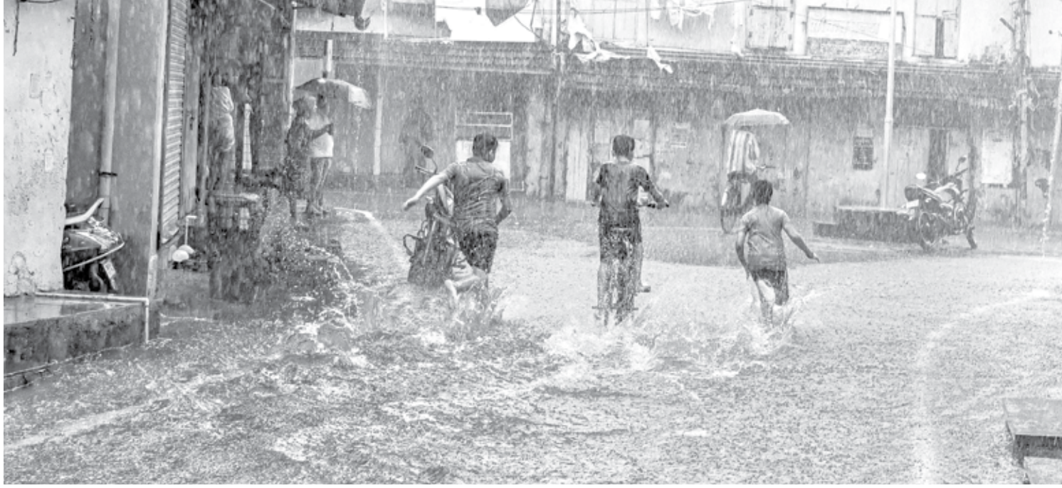
मुरुड : येथील बाजारात दमदार पावसाने पाणी साचले. या पाण्यात बच्चेकंपनीने रविवारच्या सुट्टीचा आनंद घेतला.

नागरिक पडून वाहून गेला होता. त्यामुळे पुलाला संरक्षण कठडा करणे गरजेचे आहे. या संदर्भात प्रशासनाने पावले उचलून कार्यवाही करावी, अशी मागणी परिसरातील नागरिकांकडून करण्यात येत आहे.