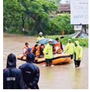
बांधकाम सुरु आहे. नदीचे पाणी वाढल्यामुळे या बांधकाम सुरु असलेल्या ठिकाणी २०

मुसळधार पावसामुळे सुधागड तालुक्यात अंबा नदीने धोक्याची पातळी ओलांडली. नदीला आलेल्या या पुरामुळे रविवारी (दि. ५) वाकण-पाली राज्य महामार्गावर वाकण आणि वजरोली गावाजवळ २८ नागरिक अडकून पडले होते. त्यांना बचाव पथकाने सुखरूप बाहेर काढले. वजरोली गावाजवळ अंबा नदीच्या किनारी काही बंगल्यांचे