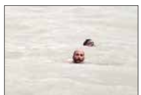
गेलेली असताना जोरदार वारे व खराब हवामानामुळे बुडाली. या नौकेवर तीन खलाशी होते. नौका बुडल्यानंतर या नौकेवरील तीन खलाशी बराच वेळ पाण्यात पोहत होते. त्यातील एका खलाशाने लाल कानटोपी घातली होती. या टोपीमुळे पोहणारे खलाशी फेरीबोट चालकाच्या लक्षात आले. मग फेरीबोटमधील खलाशांनी हवा भरलेल्या ट्यूब, दोऱ्या पाण्यात टाकून बुडणाऱ्यांना आपल्या बोटीमध्ये घेतले आणि त्यांचे प्राण वाचवले.

दिघी ते राजपुरी, आगरदंडा या परिसरात मोठी खाडी आहे. सध्या समुद्रातील मासेमारीला बंदी असल्यामुळे काही गरीब मच्छीमार खाडीमध्ये आपली छोटी नौका टाकून मच्छी मिळेल का हे पाहत असतात. अशीच एक नौका मच्छी पकडण्यासाठी दिघी खाडीत