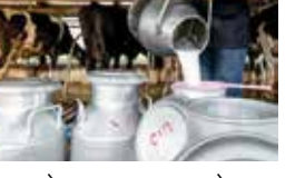
सूचना देण्यात आल्या होत्या; त्याप्रमाणेच आता दूध भेसळीच्या विरोधात कठोर पावले उचलली